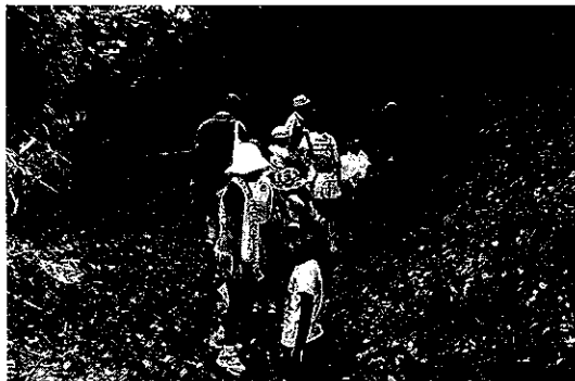
西国街道ぶらり旅2013～井口編～